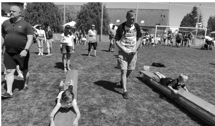
Sportovní odpoledne na kopaninském fotbalovém hřišti už mají dlouhou tradici