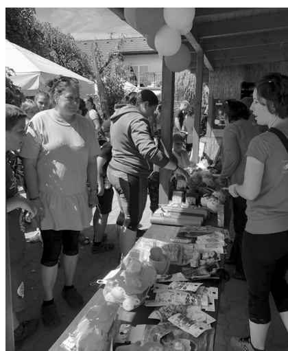
Zázemí restaurace U Drahušky