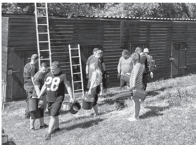
Dobrovolníci z Letiště Praha natírají vrběhy v Záchranné stanici pro zraněná zvířata AVES v Brandýsku

Stránku připravila Hana van der Hoeven, Letiště Praha