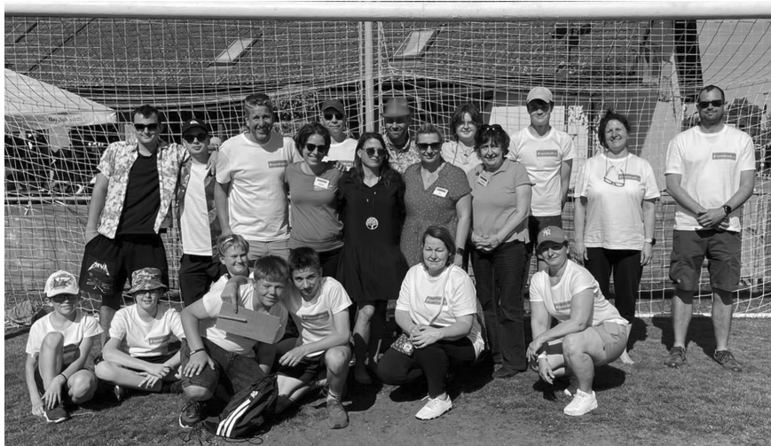
Akce Kopaninského spolku se těší velkému zájmu obyvatel naší městské části