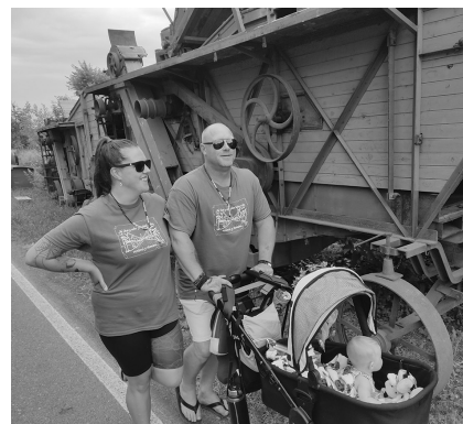
Sběratelé se opět těšili z nového trička z dílny výtvarníka Iva Medka

Máme za sebou už 23. ročník populárního pochodu Od rotundy na Okoř. A zase se to povedlo!