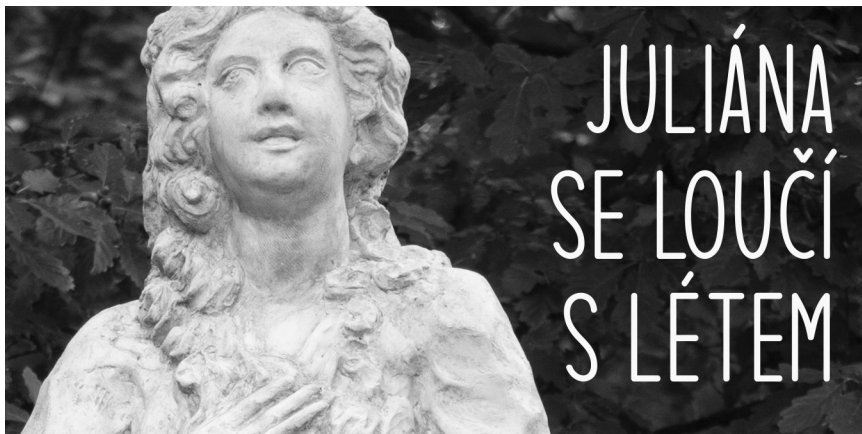
Jestli svatá Juliána požehná, mohli bychom mít na Kopanině novou událost