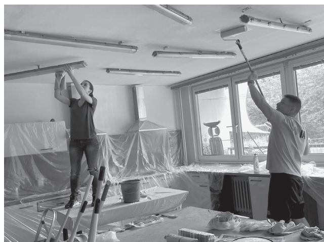
Malování v Pobytovém rehabilitačním a rekvalifikačním středisku pro nevidomé Dědina