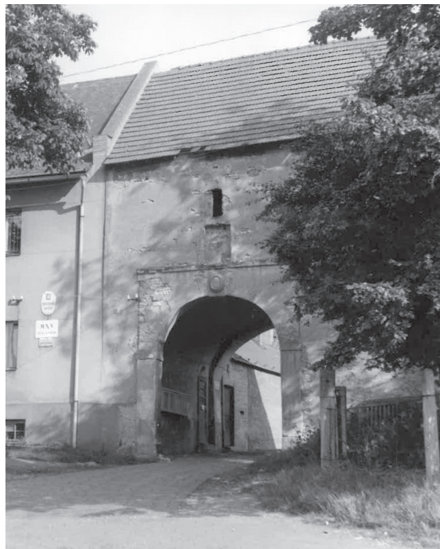
Zlé znamení? Na lidi schovávající se v průjezdu se zřítíl pilíř a brzy nato začala válka...