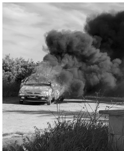
Výbušná show podle Kopičkových